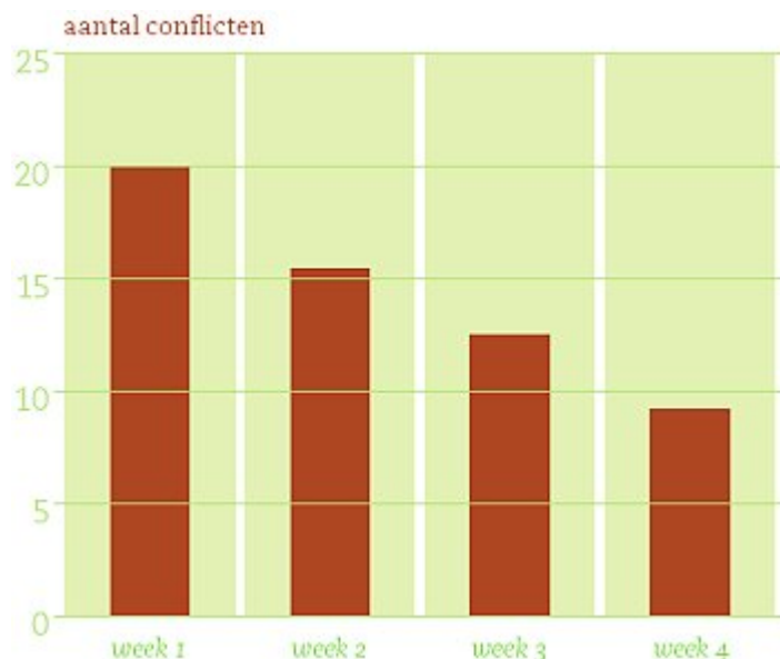
Figuur 2: conflicten op het schoolplein

Tijdens dit blok kan een school werken met een conflicthermometer . Er komt dan een grote thermometer in de hal te hangen, waarop het aantal conflicten op het schoolplein wordt bijgehouden. De resultaten worden uitgedrukt in een grafiek , die eveneens in de hal hangt.